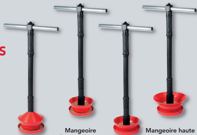
Mangeoire basse avec couvercle